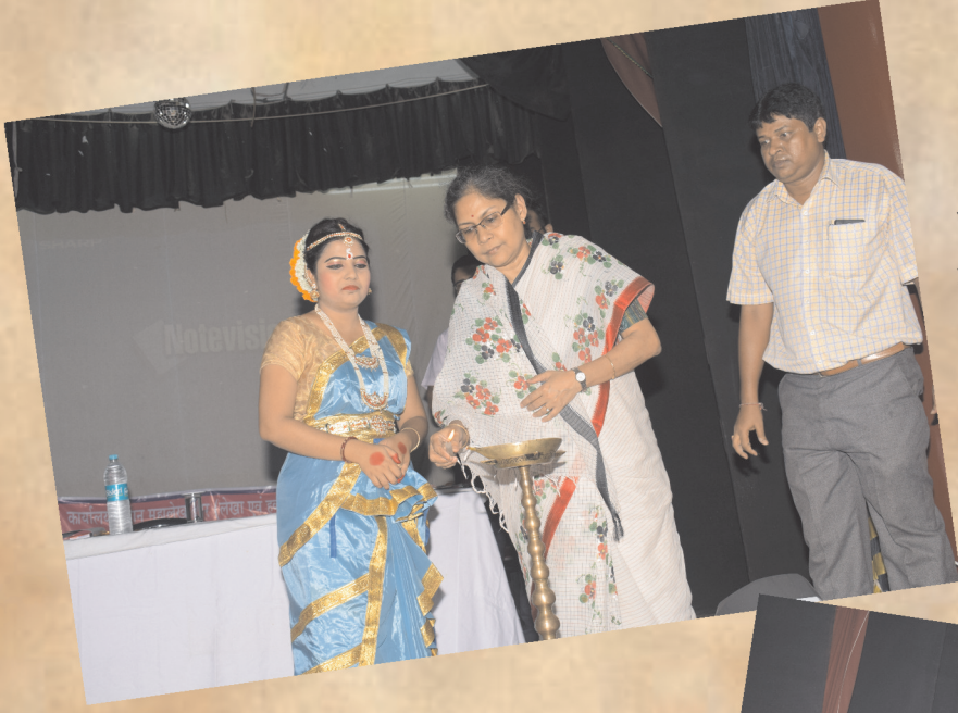
दीप प्रज्वलन कर हिन्दी दिवस कार्यक्रम का शुभारंभ करते प्रधान महालेखाकार महोदया