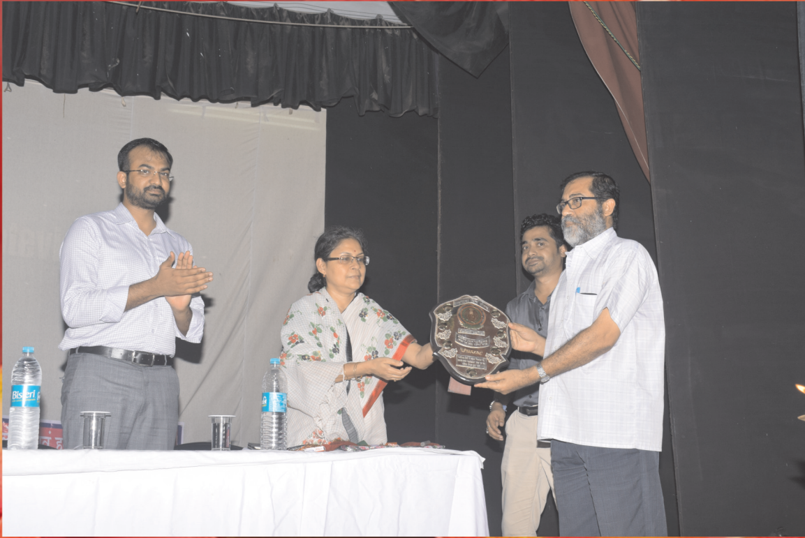
हिन्दी दिवस के अवसर पर राजभाषा मित्र शील्ड प्रदान करते हुए प्रधान महालेखाकार महोदया