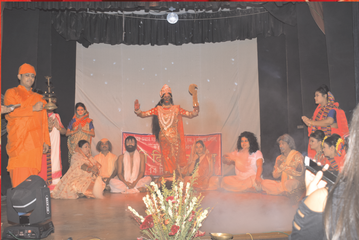
हिन्दी दिवस के अवसर पर आयोजित सांस्कृतिक कार्यक्रम की एक झलक