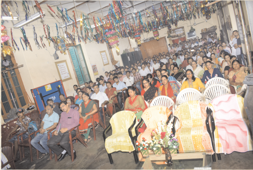
हिन्दी दिवस - 2018 की एक झलक