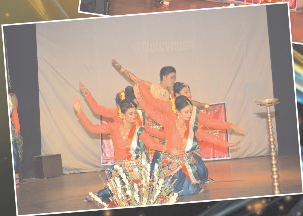
हिन्दी दिवस के अवसर पर आयोजित सांस्कृतिक कार्यक्रम की कुछ झलकियाँ